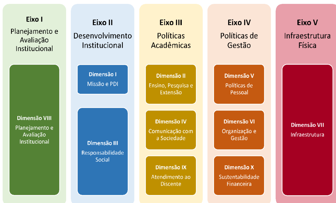
Figura 2 – Eixos e dimensões do SINAES

Essa autoavaliação, realizada em todos os cursos da IES, a cada semestre, de forma quantitativa e qualitativa, atenderá à Lei do Sistema Nacional de Avaliação da Educação Superior (SINAES), nº 10.8601, de 14 de abril de 2004. A legislação irá prever a avaliação de dez dimensões, agrupadas em 5 eixos, conforme ilustra a figura a seguir.